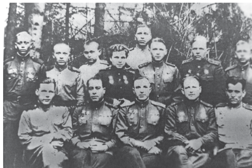
Медчасть танковой бригады Тацинского гв. танкового корпуса

Уже в воздухе столкнулись «Хейнкель» с «Юнкерсом» и разлетелись на мелкие обломки вместе со своими пассажирами. Рёв авиамоторов и танковых двигателей