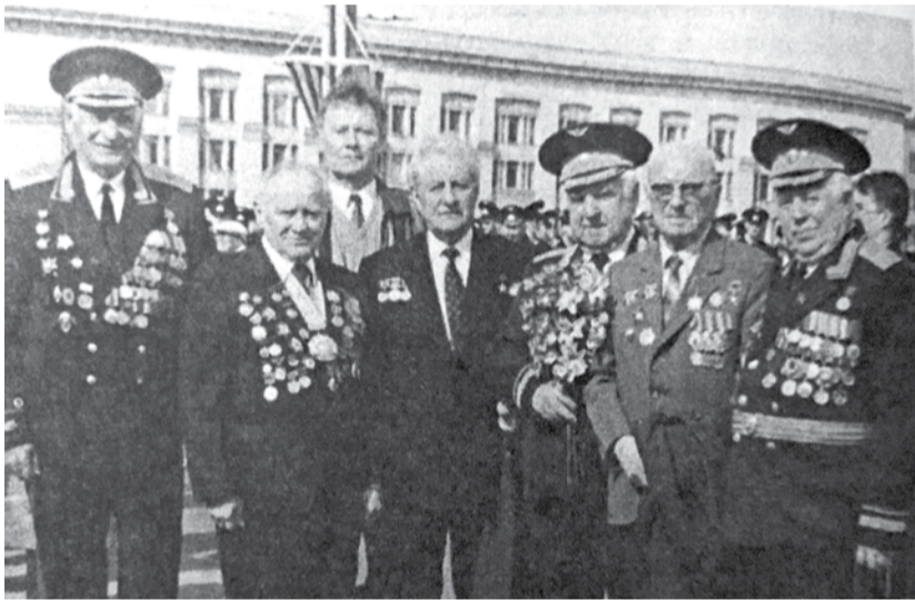
С ветеранами войны в День победы