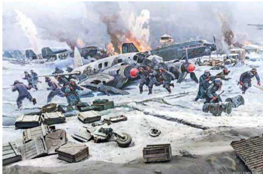
Танковая атака на вражеский аэродром в станице Тацинская

В фашистской Германии, говорят, каждый участник рейда был объявлен вне закона в качестве личных врагов Гитлера. По крайней мере, две полнокровные танковые дивизии немцев, переброшенные под станцию Тацинская, получили приказ полностью уничтожить корпус генерала Боданова, но, как видим, у них это не получилось.