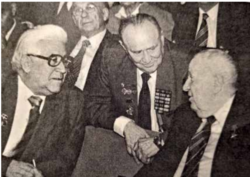
На заседании научной сессии АМН СССР. Беседа с академиком Б.В. Петровским